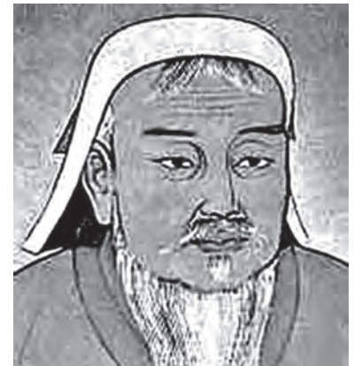
Чингис-хан (Тимучин). По старокитайскому рисунку.

Показательно и то, что не только ранние, но и поздние русские летописи, например, Московский летописный свод конца XV века или Никоновская летопись XVI века, имя "монгол" практически не знают. Везде это имя было заменено словом "татар". Только