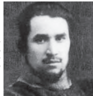
Мирсаид Султан-Галиев - крупный политический деятель эпохи Октябрьской революции 1917 г. и первых лет советской власти, одаренный литератор, талантливый публицист, общественный мыслитель мирового масштаба, видный теоретик освободительного движения народов ислама.