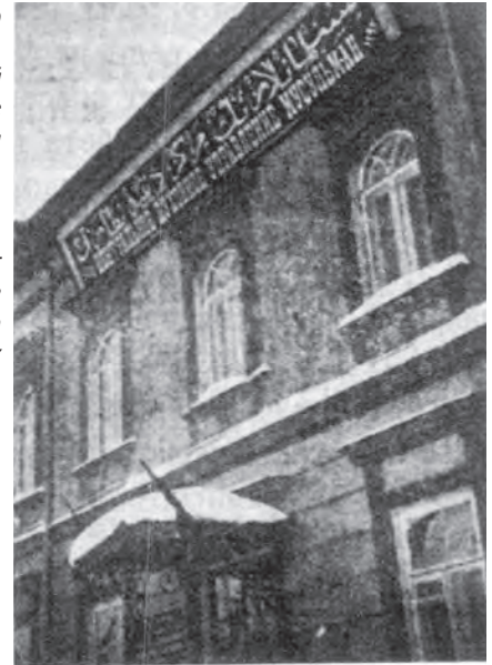
Здание Центрального духовного управления, Уфа, ул. Тукаева, 50. 1926 г.

частных пожертвований. Обучаться в них могут лица, достигшие 18 лет. Разрешение преподавания мусульманского вероучения было последней уступкой в религиозном вопросе со стороны властей. В дальнейшем был принят ряд подзаконных актов и инструкций, в том числе дополнение НКВД от 23 декабря 1924 г., которые свели на нет возможность реализации постановления ЦИК и СНК СССР.