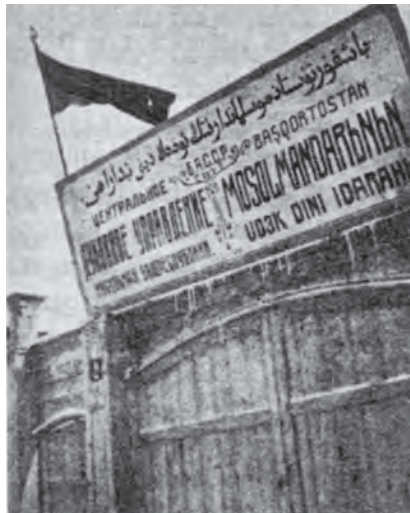
Духовное управление мусульман БАССР, Уфа, ул. Телеграфная, 2. 1926 г.

говорилось о недопустимости с одной стороны репрессий в отношении мулл, с другой - разрешения обучения исламу в советских школах. Подчеркивалось, что богословские школы могут быть устроены в мечетях, на дому за счет добровольных