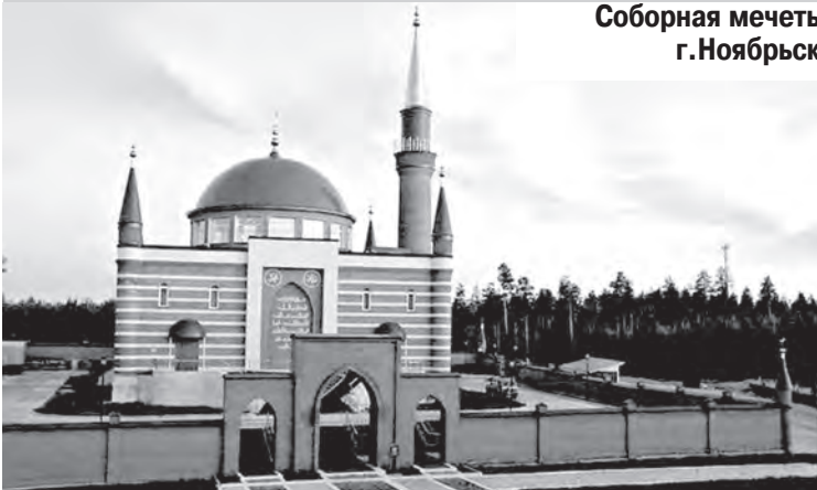
Соборная мечеть г.Ноябрьск

получать среднее общеобразовательное знание и готовиться для поступления в Российский исламский университет ЦДУМ России. Выучившись там, они будут морально и психологически готовы вести религиозно-просветительскую работу.